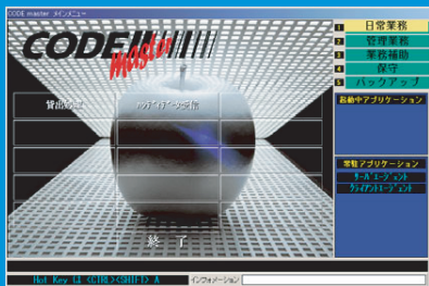
メインメニュー画面